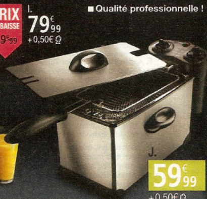
■ Qualité professionnelle !