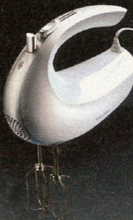
■ Batteur/mixeur (E2)