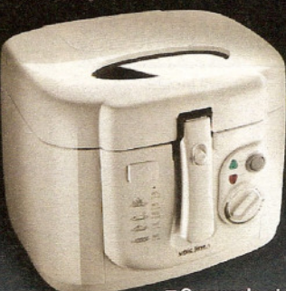
■ Couvercle et cuve amovibles (G2)