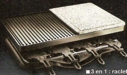
■ 3 en 1 : raclette, grill, cuisson sur pierre (A2)