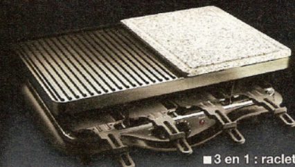
■ 3 en 1 : raclette, grill, cuisson sur pierre (A2)