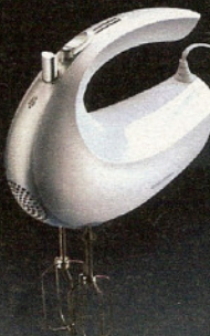
■ Batteur/mixeur (E2)