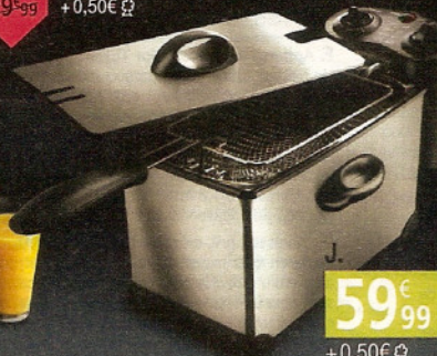
■ Qualité professionnelle !