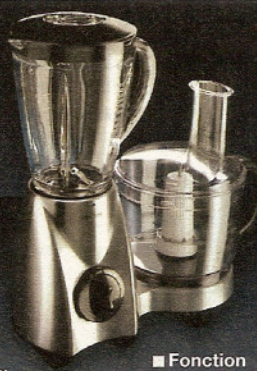
■ Fonction centrifugeuse