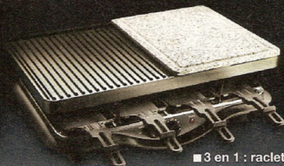
■ 3 en 1 : raclette, grill, cuisson sur pierre (A2)