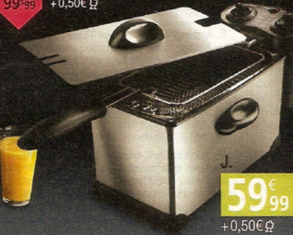
■ Qualité professionnelle !